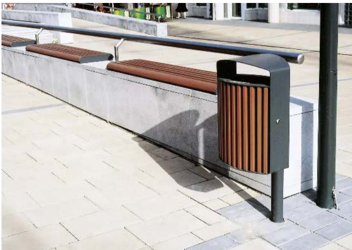
Abfallbehälter LENA mit Ascher, 30 Liter, mit Pfosten zum Aufdübeln, Korpus: Jatobaholzbelattung, Stahlteile in RAL 7016 anthrazitgrau