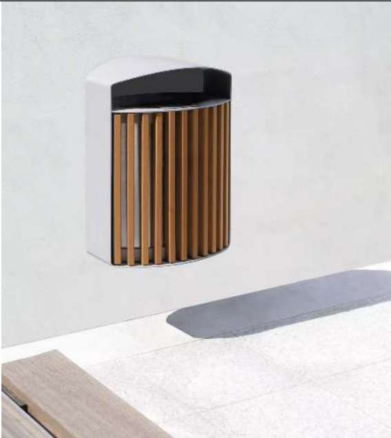
Abfallbehälter LENA mit Ascher, 30 Liter, zur Wandbefestigung, Korpus: Jatobaholzbelattung, Stahlteile in RAL 9006 weißaluminium