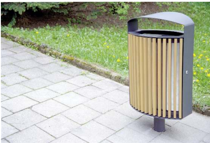
Abfallbehälter LENA mit Ascher, 70 Liter, mit Standfuß zum Aufdübeln, Korpus: Robinienholzbelattung, Stahlteile in RAL 7016 anthrazitgrau