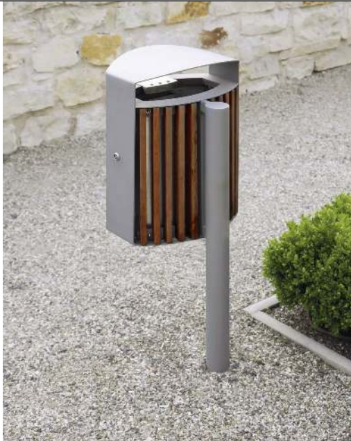
Abfallbehälter LENA mit Ascher, 30 Liter, mit Pfosten zum Aufdübeln, Korpus: Jatobaholzbelattung, Stahlteile in RAL 9006 weißaluminium