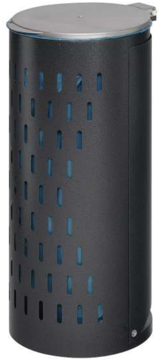
Abfallbehälter MAGHULL, mit Tür (geöffnet), in antik-silber