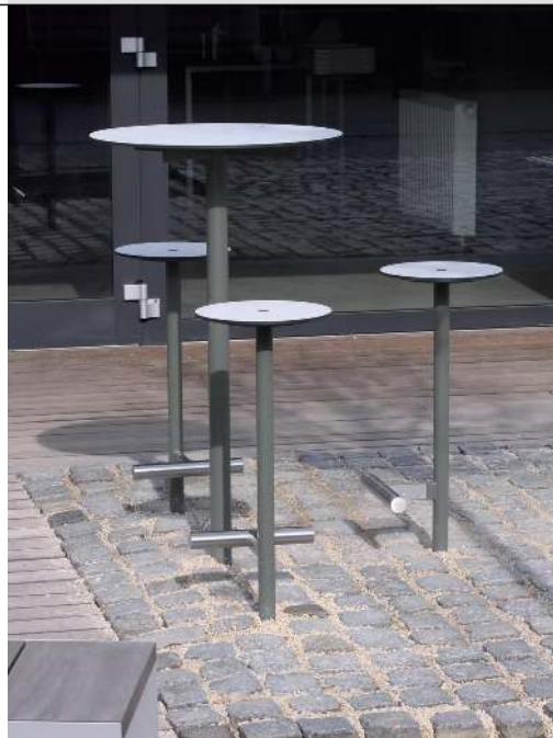
3 Barhocker und Stehtisch BISTROT mit HPL-Auflage in White 0085, Stahlteile in RAL 9007 graualuminium