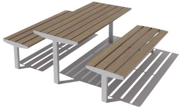
Sitzbänke und Tisch VERA SOLO mit Jatobaholzbelattung, Stahlteile in RAL 9007 graualuminium