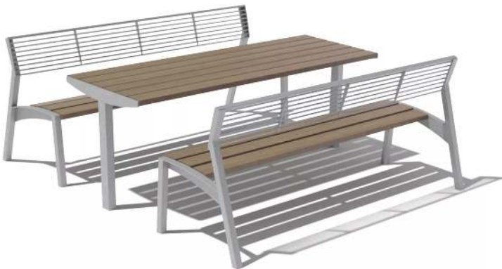
Sitzbänke VERA mit Tisch VERA SOLO (Sonderanfertigung auf Anfrage), mit Jatobaholzbelattung, Stahlteile in RAL 9007 graualuminium