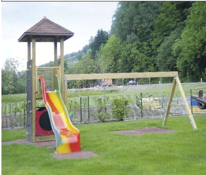
Spielturmkombination RAPUNZEL mit Sonderdachausführung (auf Anfrage)