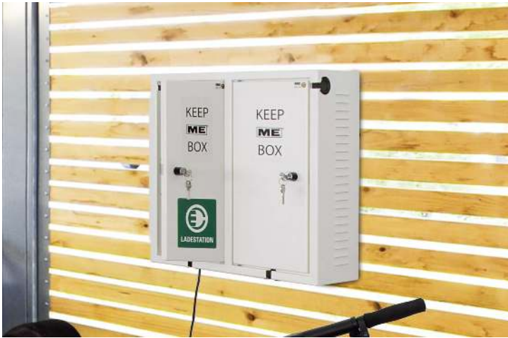
Ladegerätebox KEEP ME, 2 Schließfächer in RAL 9010 reinweiß, Wandbefestigung