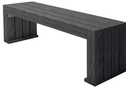
Sitzbank CERMES aus Recyclingkunststoff in schwarz