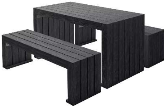
Kombinationsvorschlag: Bank-Tisch-Kombination CERMES aus Recyclingkunststoff in schwarz, bestehend aus einem Tisch und zwei Sitzbänken