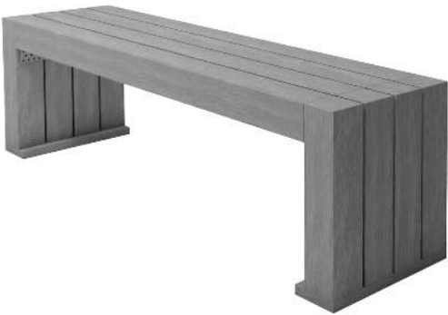
Sitzbank CERMES aus Recyclingkunststoff in grau<br>