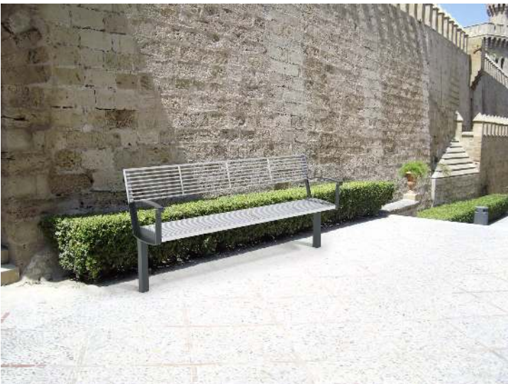
Seniorenbank INTERVERA, Auflage Edelstahl, Unterkonstruktion in RAL 7016 anthrazitgrau