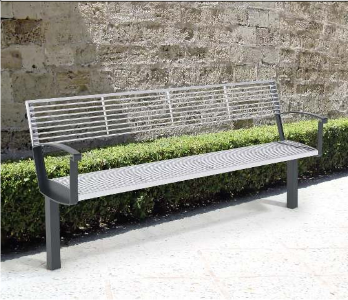
Seniorenbank INTERVERA, Auflage Edelstahl, Unterkonstruktion in RAL 7016 anthrazitgrau