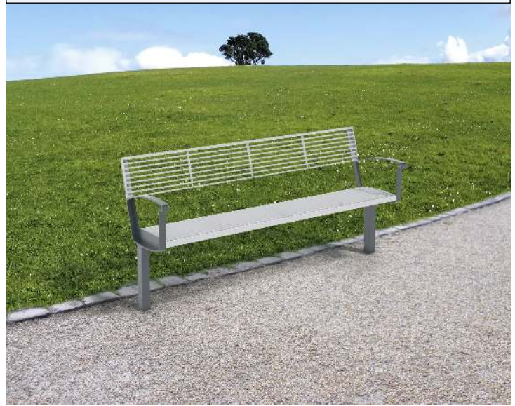
Seniorenbank INTERVERA, Auflage in RAL 9006 weißaluminium, Unterkonstruktion in RAL 9007 graualuminium