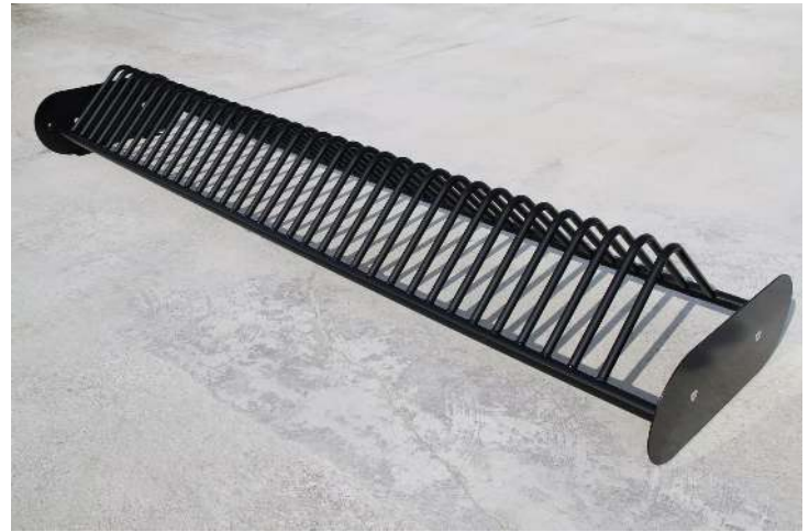
Fahrradständer TEMPE mit Betonsockel