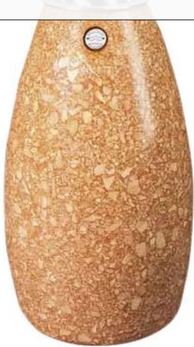
Standascher PLUTONE aus Marmor geschliffen, in veronarot