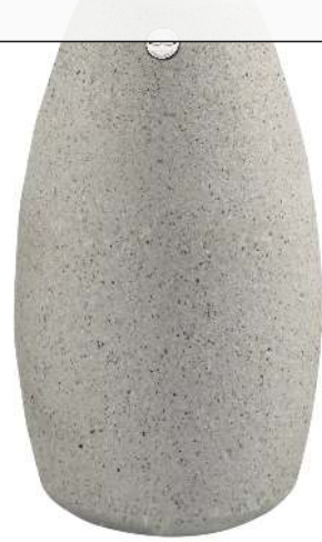
Standascher PLUTONE aus Beton gestockt, in Granitoptik weiß