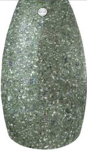
Standascher PLUTONE aus Marmor gestockt, in grün alpi