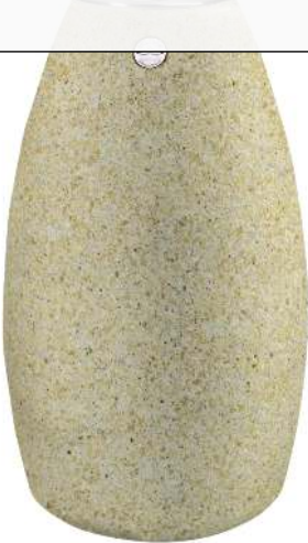
Standascher PLUTONE aus Marmor gestockt, in gelb mori