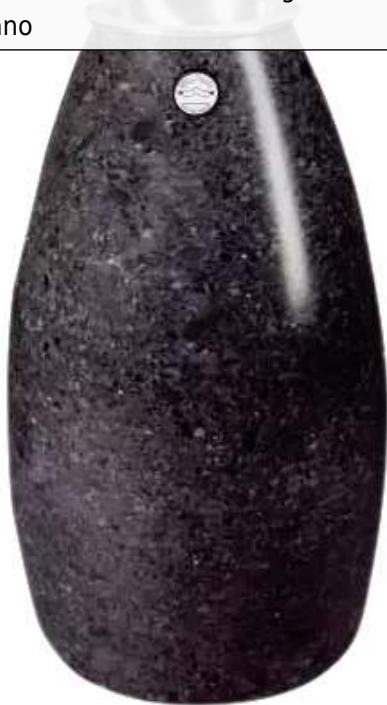
Standascher PLUTONE aus Marmor geschliffen, in schwarz ebano