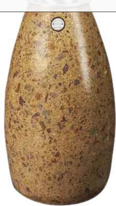
Standascher PLUTONE aus Marmor geschliffen, in porphyr