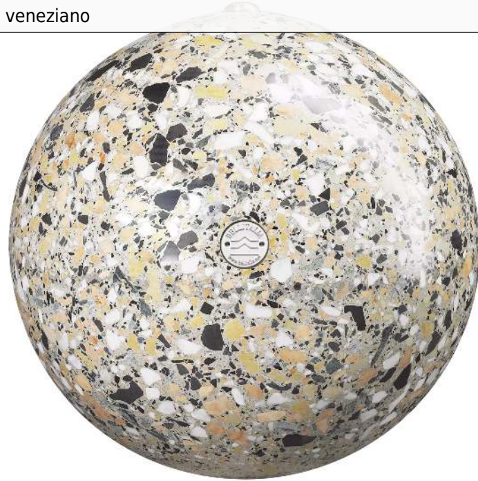
Poller SFERA aus rekonstituiertem Marmor geschliffen, in veneziano