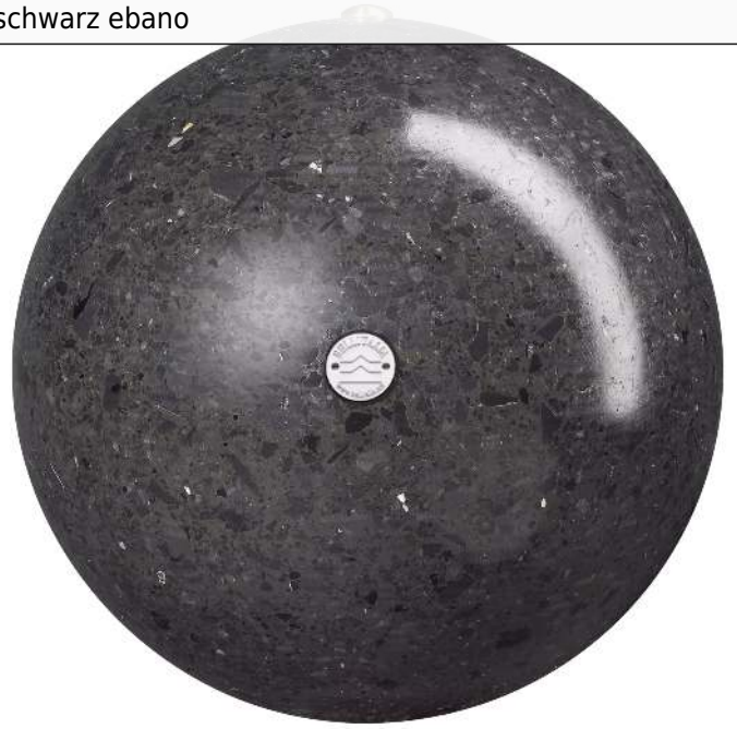
Poller SFERA aus rekonstituiertem Marmor geschliffen, in schwarz ebano