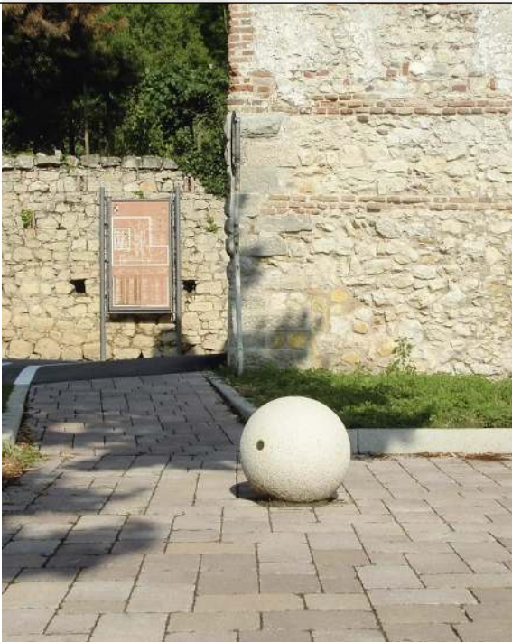
Poller SFERA aus Beton gestockt, in Granitoptik weiß