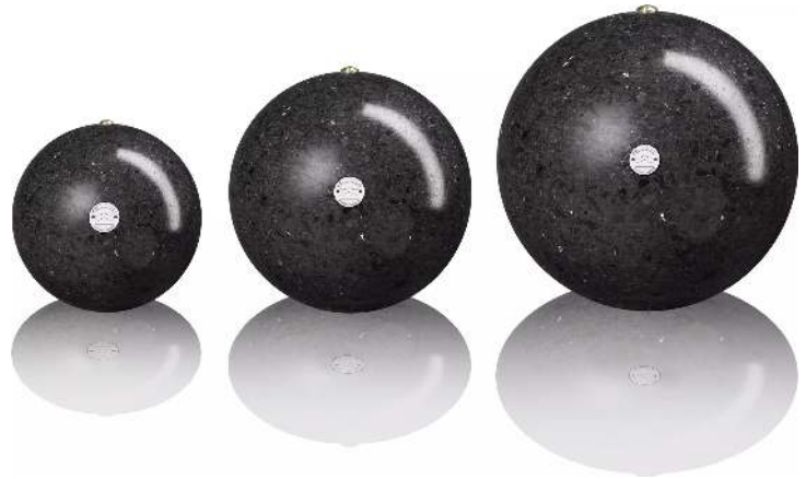
Poller SFERA aus rekonstituiertem Marmor geschliffen, in schwarz ebano