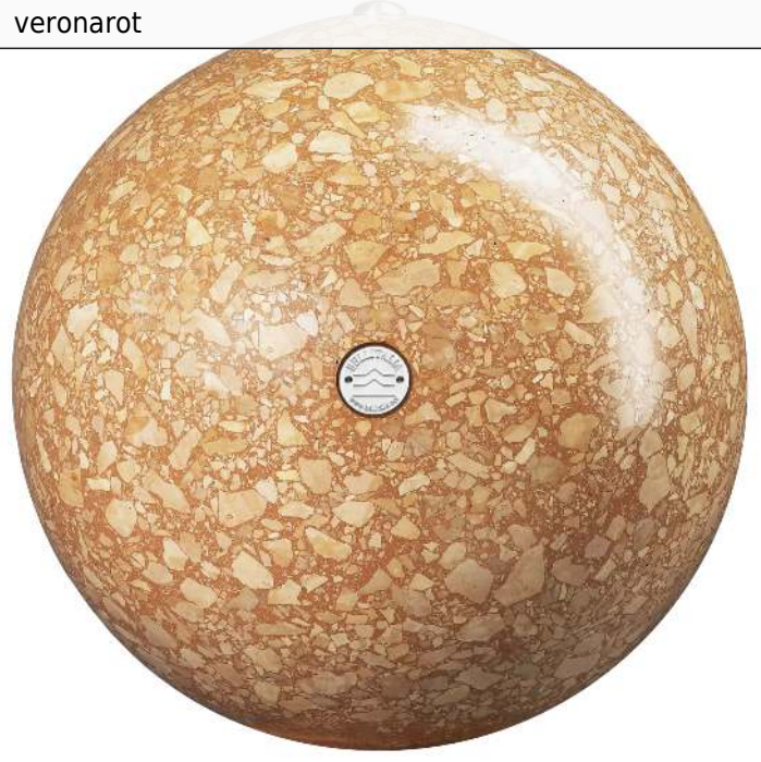
Poller SFERA aus rekonstituiertem Marmor geschliffen, in veronarot