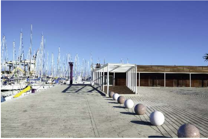
Poller SFERA aus rekonstituiertem Marmor geschliffen, in weiß carrara und porphy