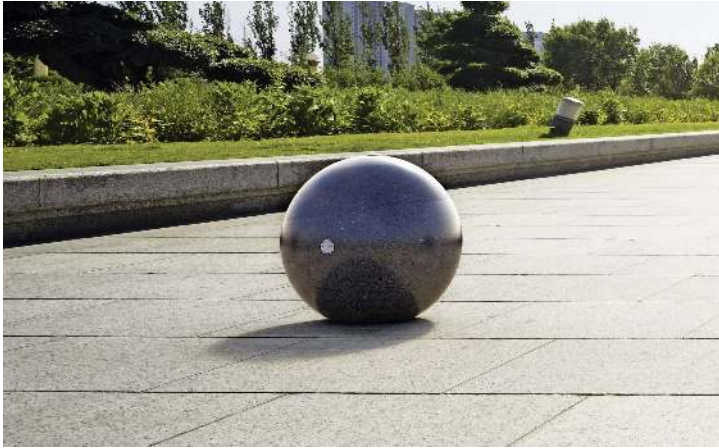
Poller SFERA aus rekonstituiertem Marmor geschliffen, in schwarz ebano