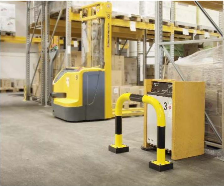
Flexibler Rammschutzbügel NILSA