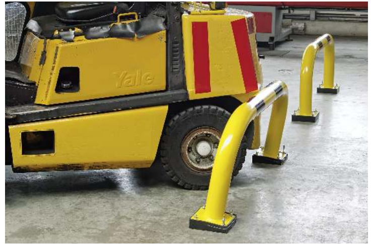
Flexibler Rammschutzbügel NILSA, gelb kunststoffbeschichtet mit schwarzen Signalstreifen