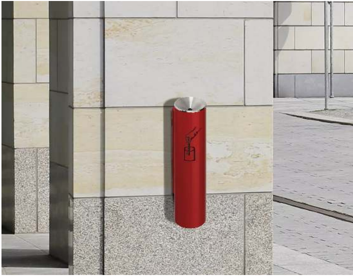
Ascher FERGUS, in RAL 3000 feuerrot