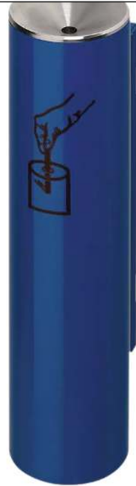
Ascher FERGUS, in RAL 5010 enzianblau