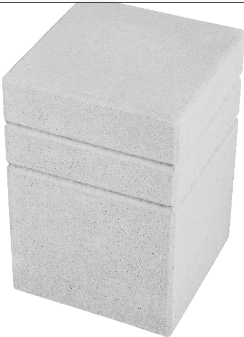
Poller BRNO, Höhe 450 mm, Beton sandgestrahlt