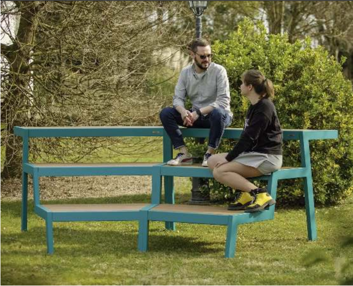
Tribünenbank ESPRIT bestehend aus 2 Einzelementen, gewinkelt 30°, modular erweiterbar, Stahlteile in RAL 5021 wasserblau