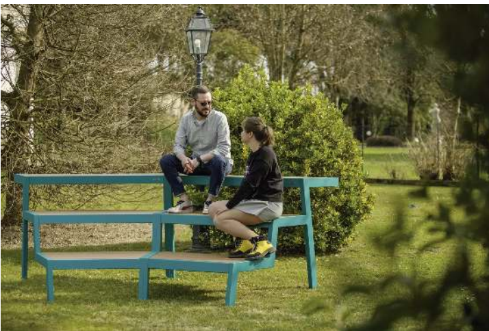
Tribünenbank ESPRIT bestehend aus 2 Einzelementen, gewinkelt 30°, modular erweiterbar, Stahlteile in RAL 5021 wasserblau