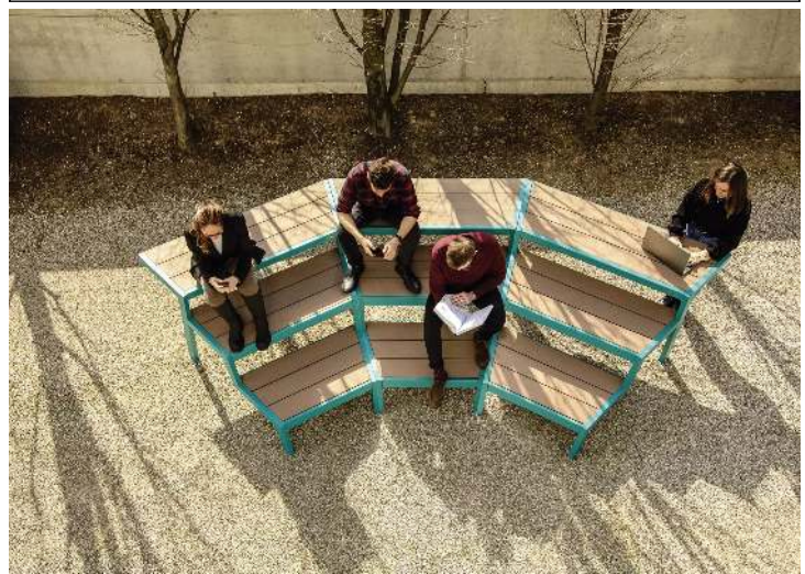
Tribünenbank ESPRIT bestehend aus 3 Einzelementen, gewinkelt 30°, modular erweiterbar, Stahlteile in RAL 5021 wasserblau