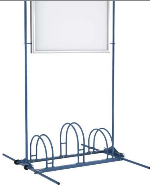
Werbe-Fahrradständer ROCKFORD, mit wasserdichtem Alu-Klapprahmen, 3 Stellplätze, in RAL 5010 enzianblau