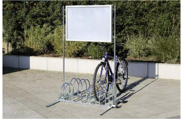
Werbe-Fahrradständer ROCKFORD, mit wasserdichtem Alu-Klapprahmen, 6 Stellplätze, galvanisch verzinkt