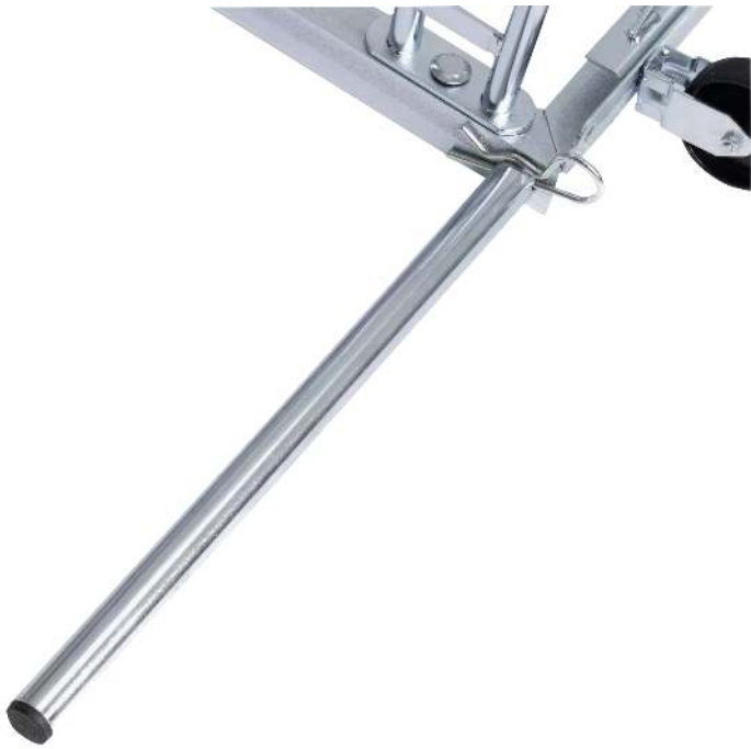
Werbe-Fahrradständer ROCKFORD, Werbefläche aus Stahlblech, 3 Stellplätze, , galvanisch verzinkt