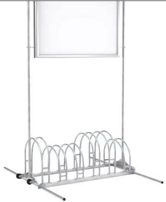
Werbe-Fahrradständer ROCKFORD, mit wasserdichtem Alu-Klapprahmen, 6 Stellplätze, galvanisch verzinkt