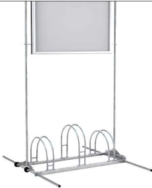
Werbe-Fahrradständer ROCKFORD, mit wasserdichtem Alu-Klapprahmen, 3 Stellplätze, galvanisch verzinkt