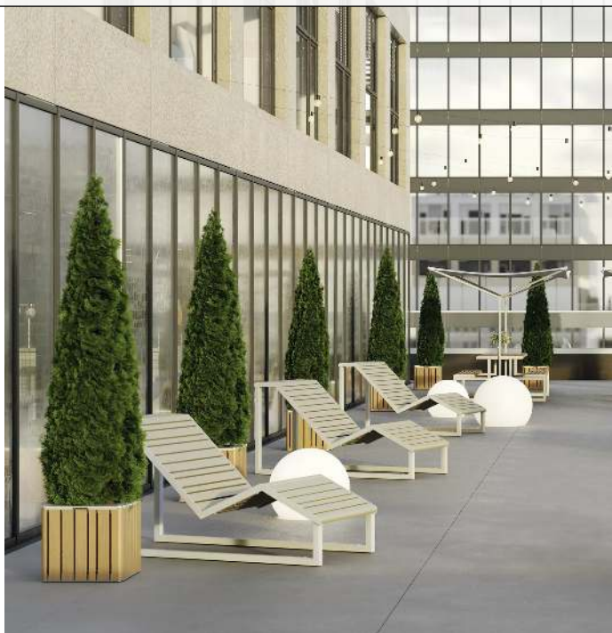
2 Liegebänke MANTUA, Aluminium in natürlichem Eschenholzoptik-Effekt, Stahlteile in RAL 9003 signalweiß