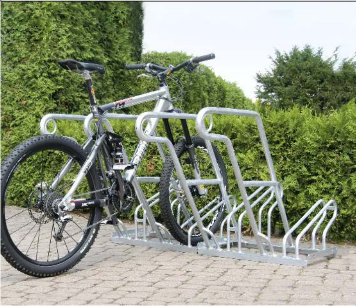
Fahrradständer NORWALK, einseitig, 4 Stellplätze, 4 Anlehnbügel