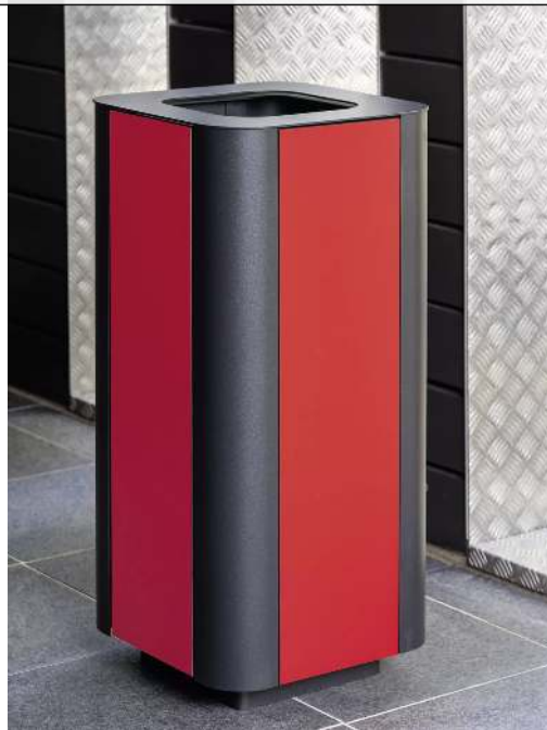
Abfallbehälter PAOSA, quadratisch, Stahlteile in DB 703 eisenglimmer, Korpus aus HPL in rot