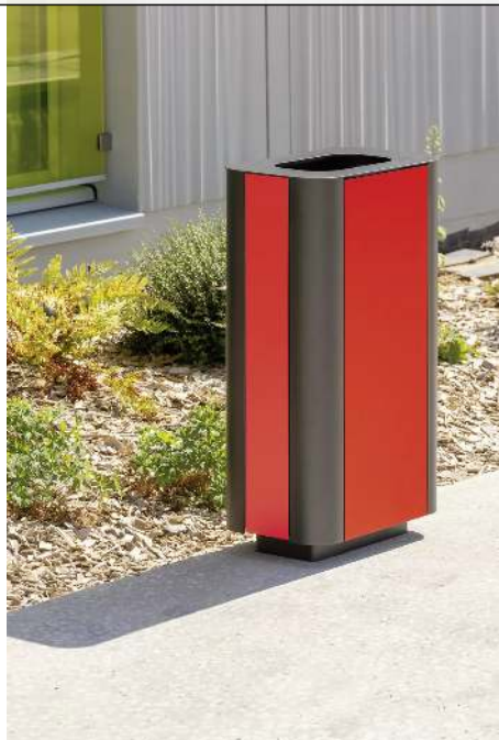
Abfallbehälter PAOSA, Stahlteile in DB 703 eisenglimmer, Korpus aus rotem Zedernholz