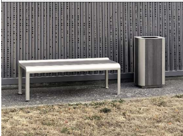
Abfallbehälter und Sitzbank PAOSA, Stahlteile in RAL 7044 seidengrau, Sitzauflage aus grauem Zedernholz