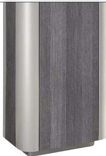
Abfallbehälter PAOSA, rechteckig, Stahlteile in RAL 9006 weißaluminium, Korpus aus HPL in grauer Zedernholzoptik