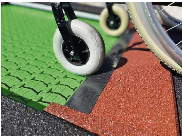
Bodentrampolin RANDI, Umrandung in schwarz sowie rot-braun, Sprungmatte ähnlich RAL 6029 minzgrün