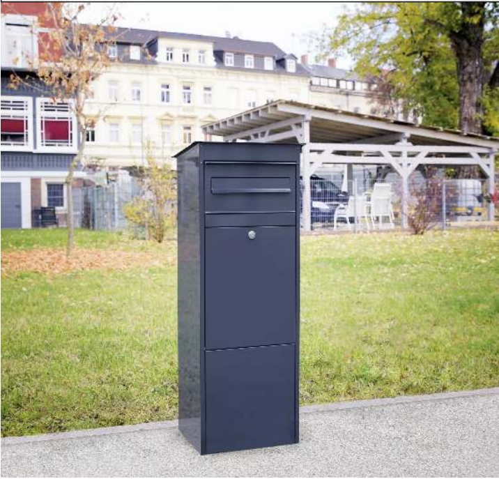
Brief- und Paketkasten BREST in RAL 7016 anthrazitgrau