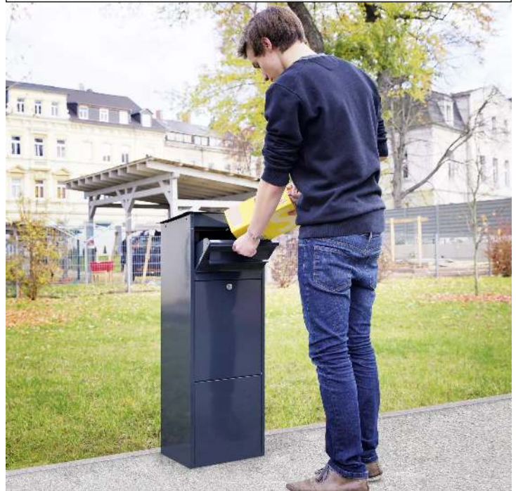
Post in Einwurfklappe einlegen