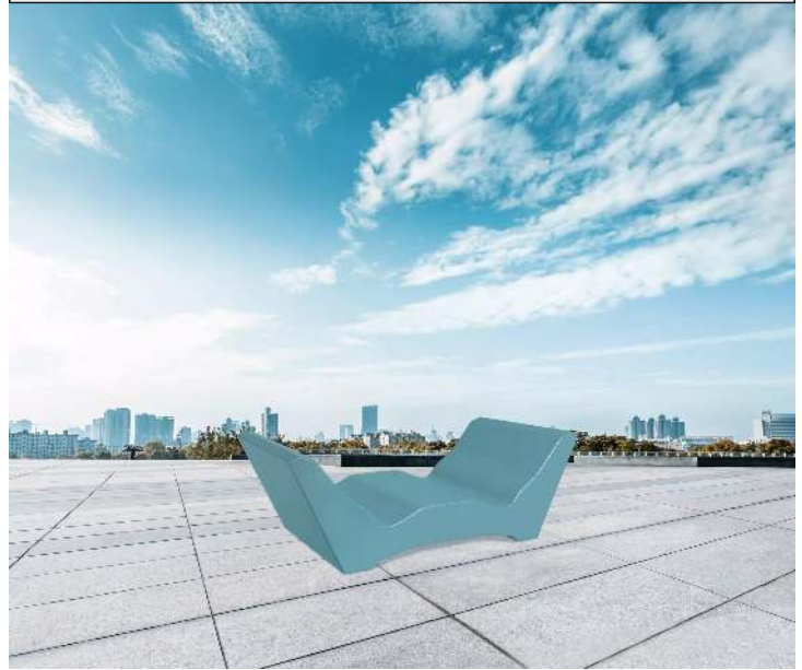
Doppelliegebank COMMUNICATION WEST in RAL 5021 wasserblau