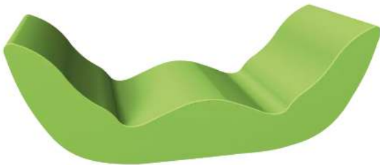
Doppelliegebank COMMUNICATION GERNI in RAL 6018 gelbgrün