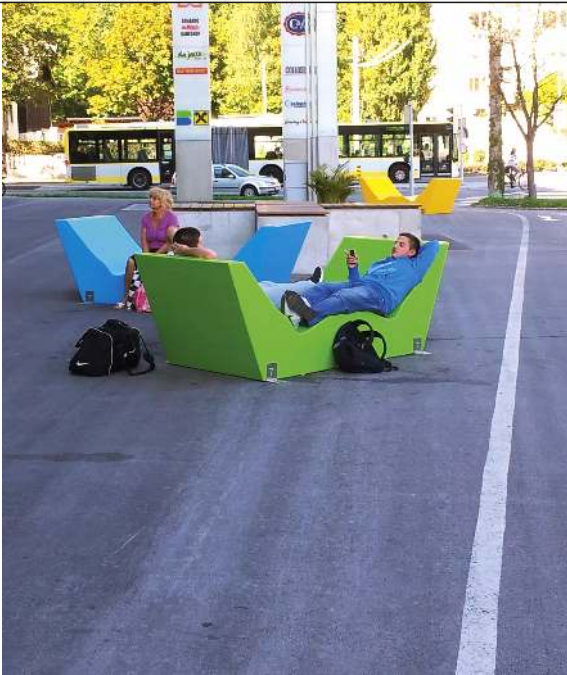
Doppelliegebank COMMUNICATION WEST in RAL 5012 lichtblau und RAL 6018 gelbgrün