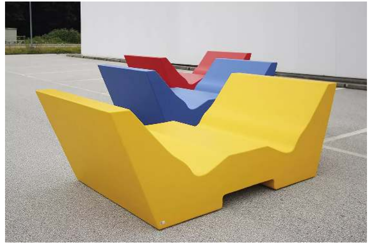
Doppelliegebank COMMUNICATION WEST in RAL 1004 goldgelb, RAL 5005 signalblau und RAL 3003 rubinrot, mit Hubausnehmung (auf Anfrage)