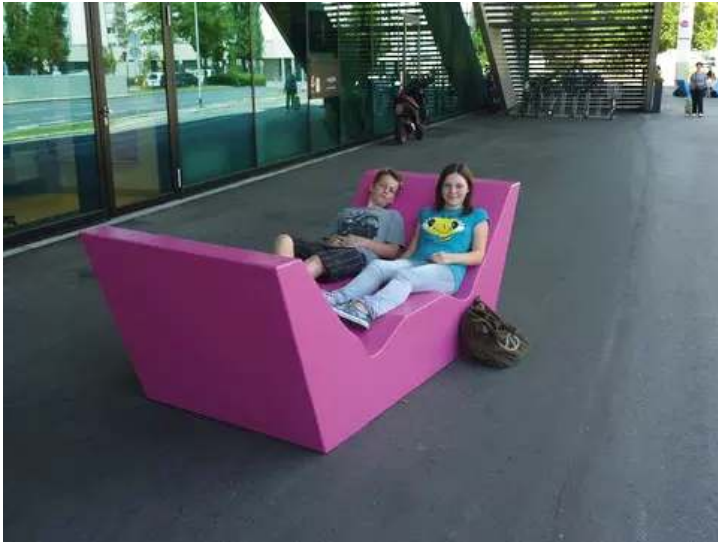
Doppelliegebank COMMUNICATION WEST in RAL 4006 verkehrspurpur