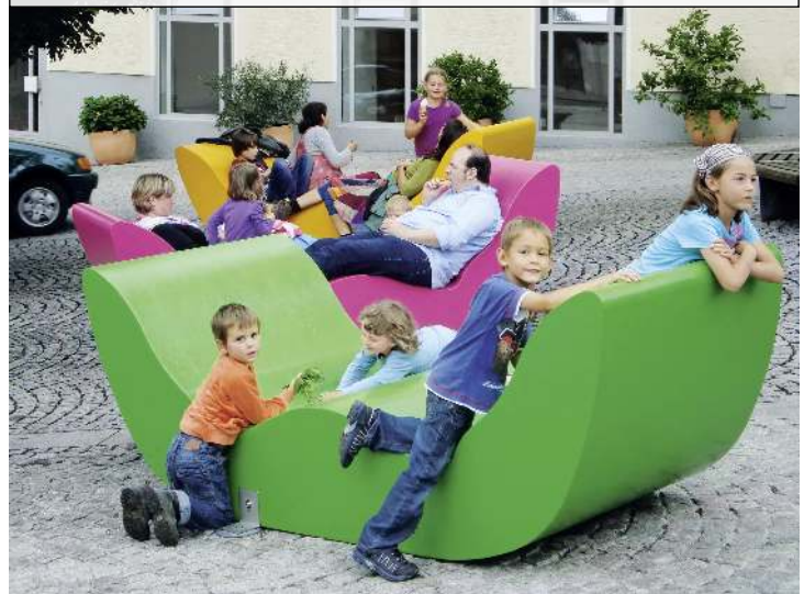
Doppelliege COMMUNICATION GERNI in RAL 6018 gelbgrün, RAL 4006 verkehrspurpur und RAL 1003 signalgelb