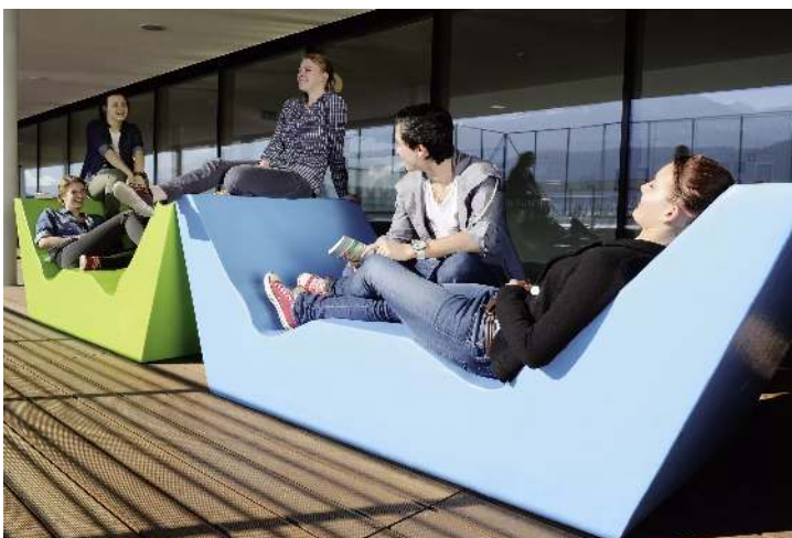
Doppelliegebänke COMMUNICATION WEST in RAL 6018 gelbgrün und RAL 5012 lichtblau