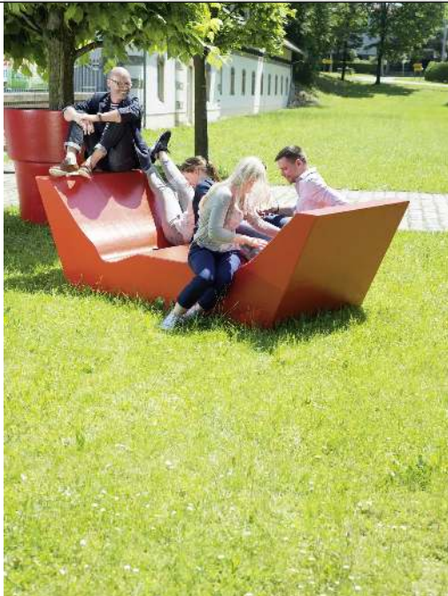
Doppelliegebänk COMMUNICATION WEST in RAL 2001 rotorange und Baumtopf QBIQ in RAL 3020 verkehrsrot