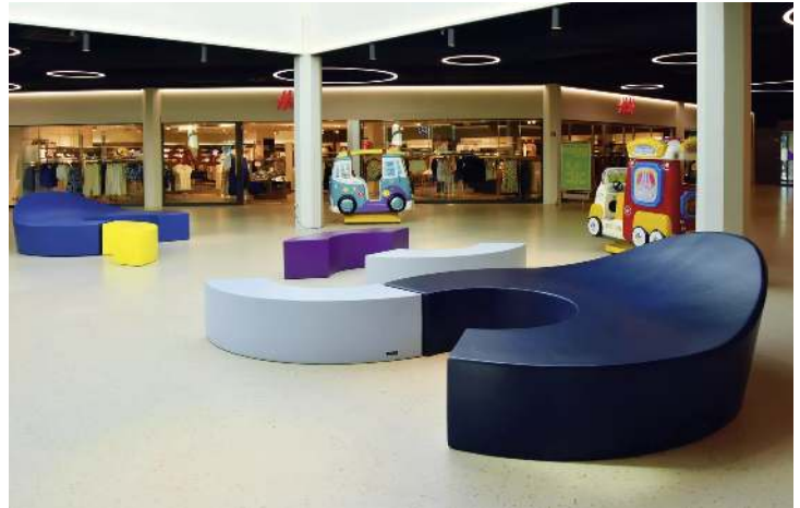
Sitzbank JOA small und Sitzbank JOA big in Sonderfarbe auf Anfrage