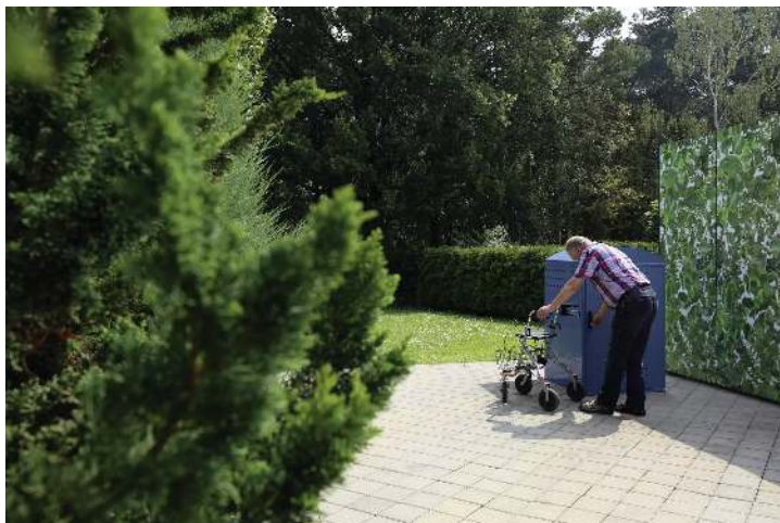
Rollatorgarage LEXINGTON, Grundeinheit mit Bogendach, Türanschlag DIN rechts, in RAL 5000 violettblau</div>