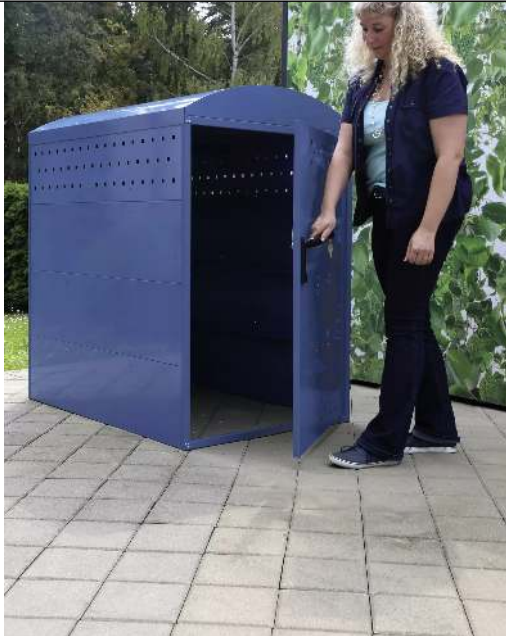
Kinderwagenbox LEXINGTON, Grundeinheit mit Bogendach, Türanschlag DIN rechts, in RAL 5000 violettblau</div>