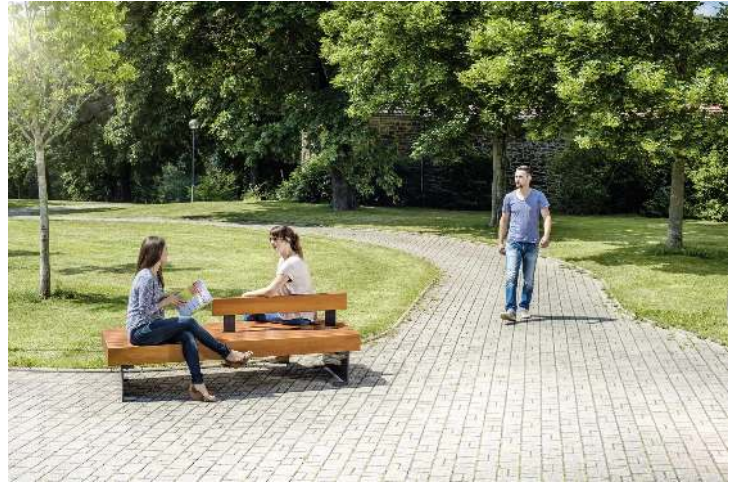
Sitzbank PESCARA doppelseitig, mit Rückenlehne, mit Lärchenholzbelattung, Stahlteile in RAL 7016 anthrazitgrau