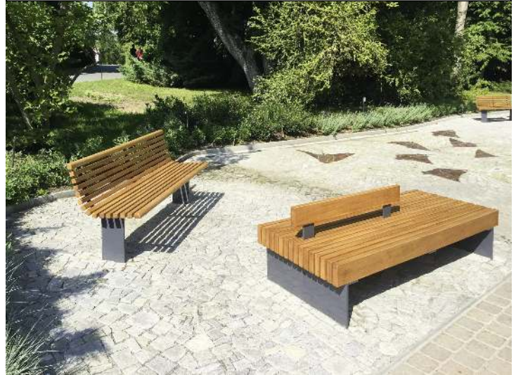
Sitzbank PESCARA doppelseitig bzw. mit zentraler Rückenlehne, mit Lärchenholzbelattung, Stahlteile in RAL 7016 anthrazitgrau