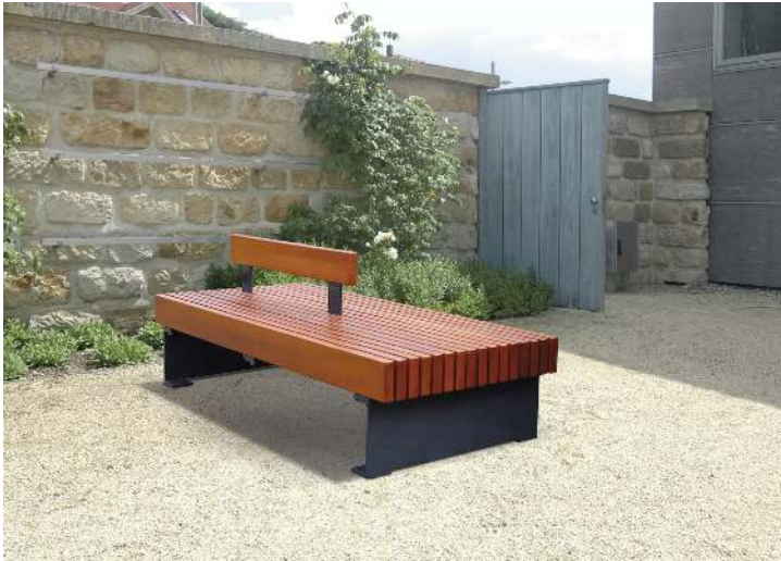
Sitzbank PESCARA doppelseitig, mit Rückenlehne, mit Merantiholzbelattung, Stahlteile in RAL 7016 anthrazitgrau