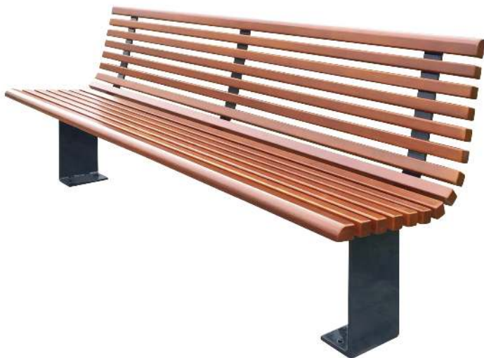
Sitzbank PESCARA mit Rückenlehne, mit Merantiholzbelattung, Stahlteile in RAL 7016 anthrazitgrau