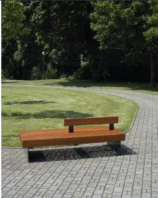
Sitzbank PESCARA doppelseitig, mit Rückenlehne, mit Lärchenholzbelattung, Stahlteile in RAL 7016 anthrazitgrau