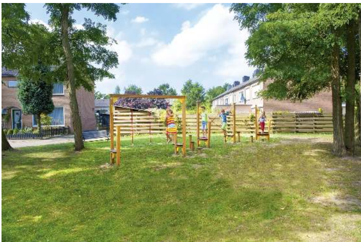
Balancierstrecken OLIVER, verschiedene Elemente