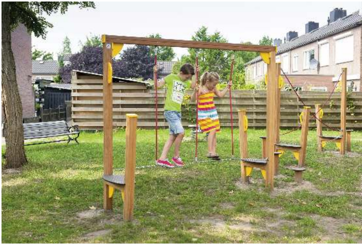
Balancierstrecke OLIVER, Element D