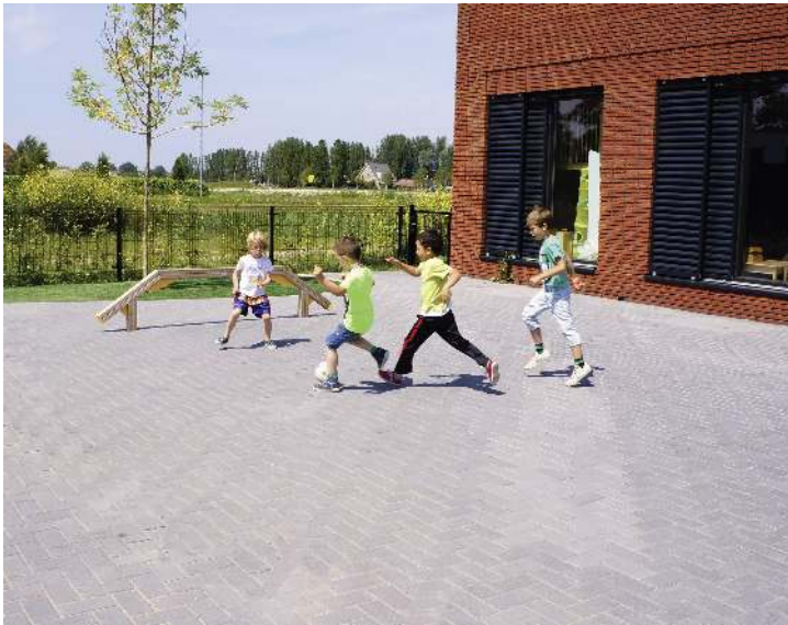
Balancierstrecke OLIVER, Element I