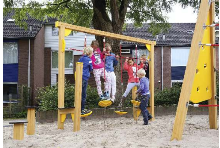
Balancierstrecke OLIVER, Element E