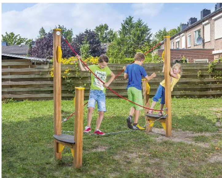
Balancierstrecke OLIVER, Element C