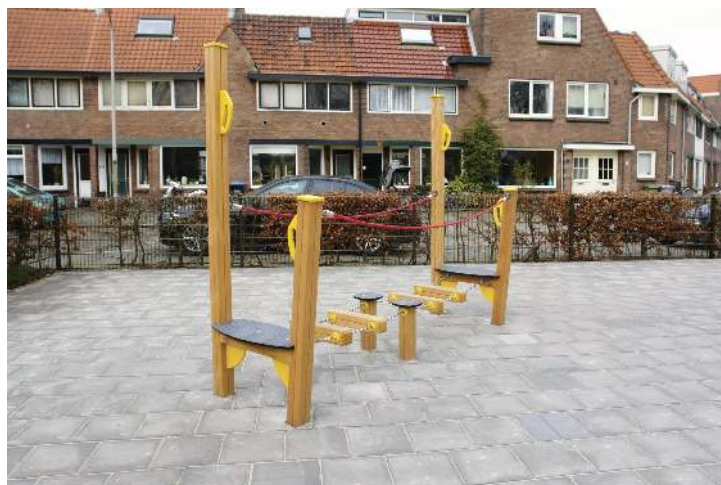
Balancierstrecke, Element A