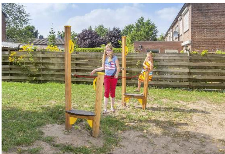
Balancierstrecke OLIVER, Element B