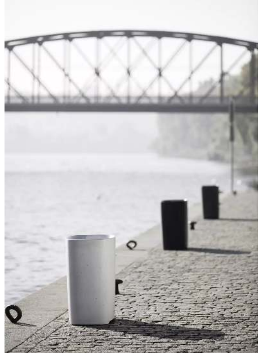
Abfallbehälter BETTER in hell- und dunkelgrau