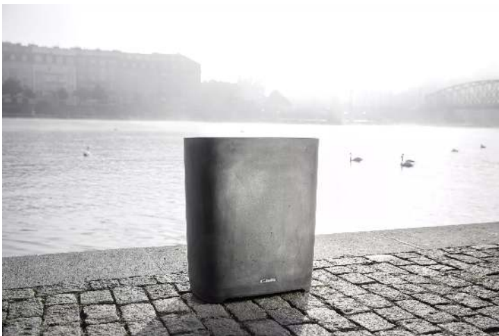
Abfallbehälter BETTER in dunkelgrau