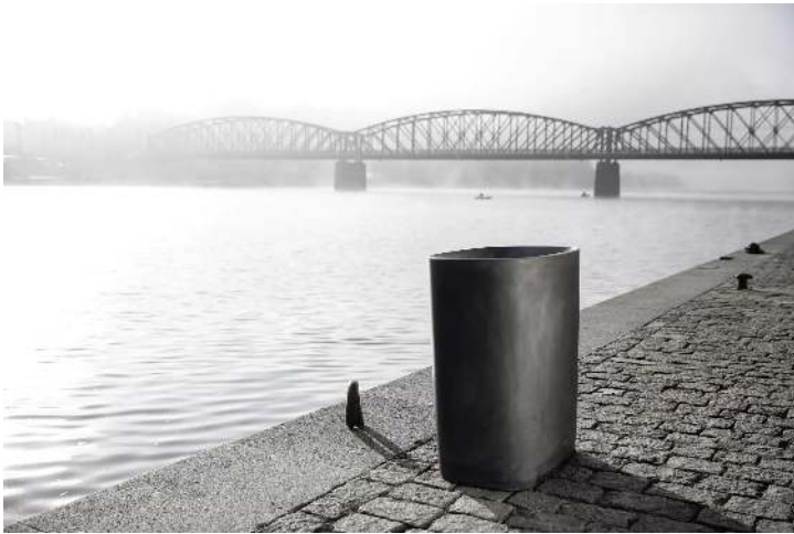
Abfallbehälter BETTER mit Innenbehälter, in dunkelgrau