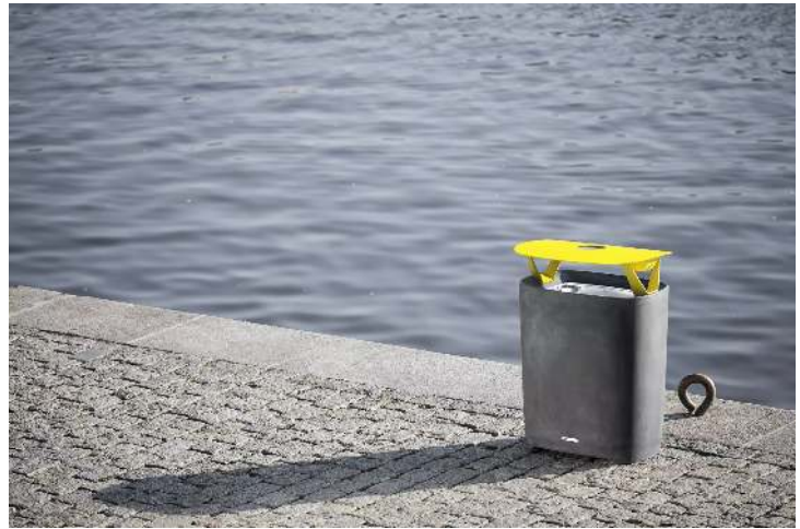
Abfallbehälter BETTER mit Schutzdach und Ascher, Behälter in dunkelgrau, Schutzdach in RAL 1021 rapsgelb