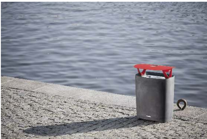
Abfallbehälter BETTER mit Schutzdach und Ascher, Behälter in dunkelgrau, Schutzdach in RAL 3020 verkehrsrot