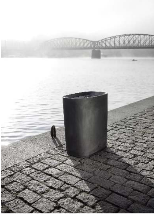
Abfallbehälter BETTER mit Innenbehälter, in dunkelgrau