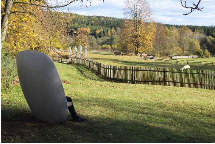
Sitzbank SATELLITE mit Jatobaholzbelattung