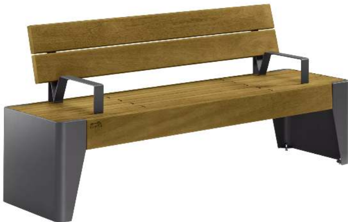
Sitzbank FOLA mit Rückenlehne und Armlehnen, Stahlteile in DB 703 eisenglimmer