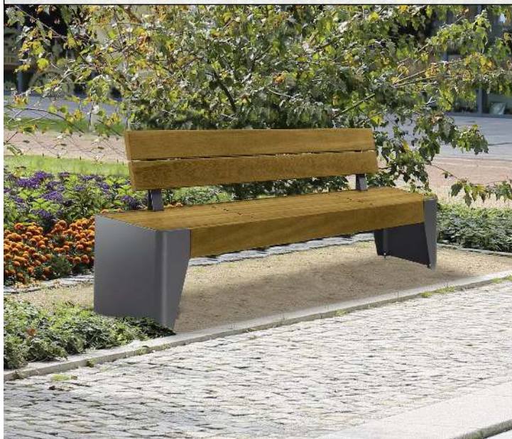
Sitzbank FOLA mit Rückenlehne, Stahlteile in DB 703 eisenglimmer