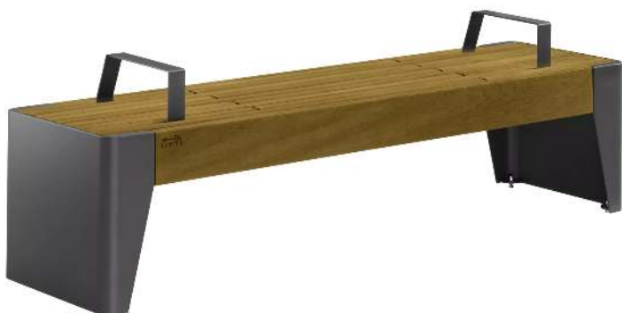
Sitzbank FOLA ohne Rückenlehne, mit Armlehnen, Stahlteile in DB 703 eisenglimmer