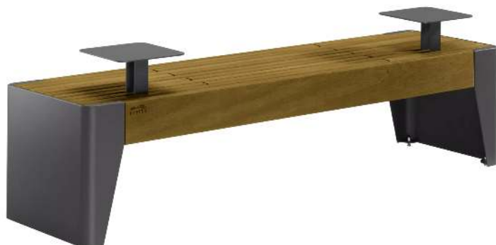
Sitzbank FOLA ohne Rückenlehne, mit Ablagetischen, Stahlteile in DB 703 eisenglimmer