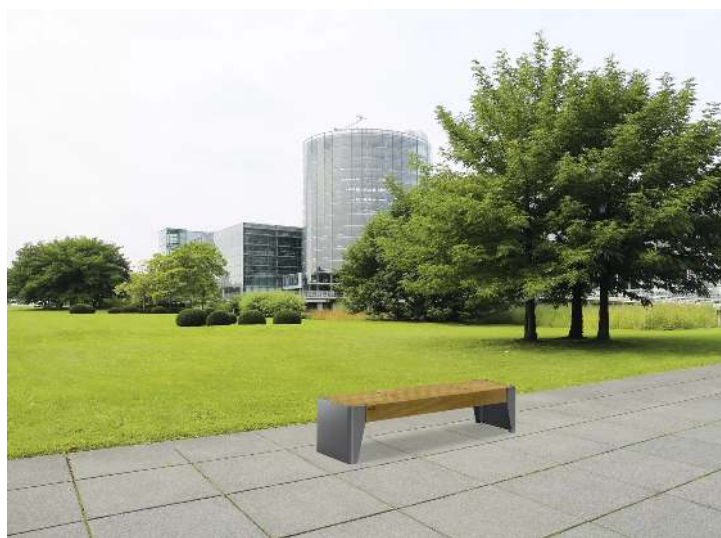
Sitzbank FOLA ohne Rückenlehne, Stahlteile in DB 703 eisenglimmer