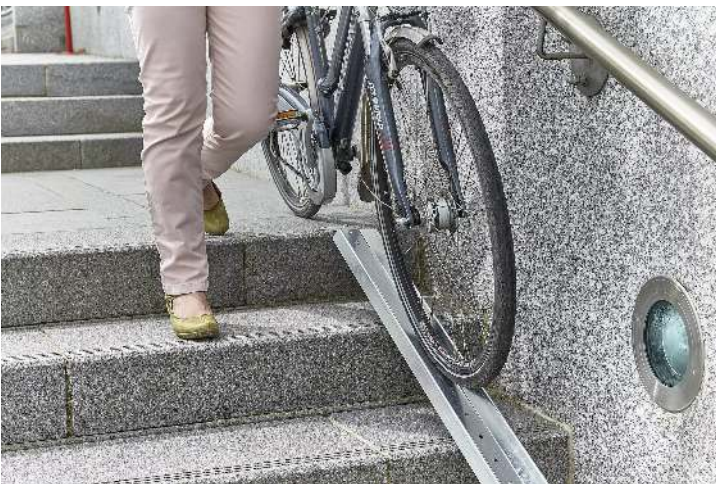
Fahrradrampe BUSAN, Basiselement