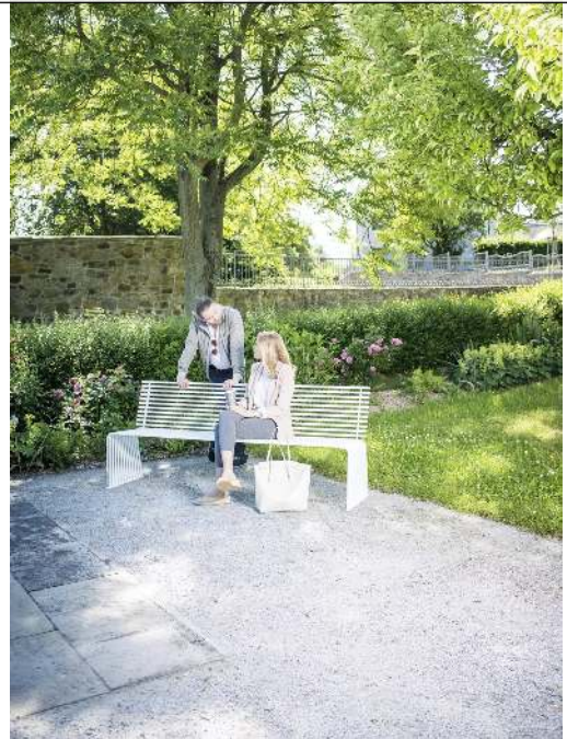
Sitzbank ANZIO mit Rückenlehne, gerade, in RAL 9003 signalweiß