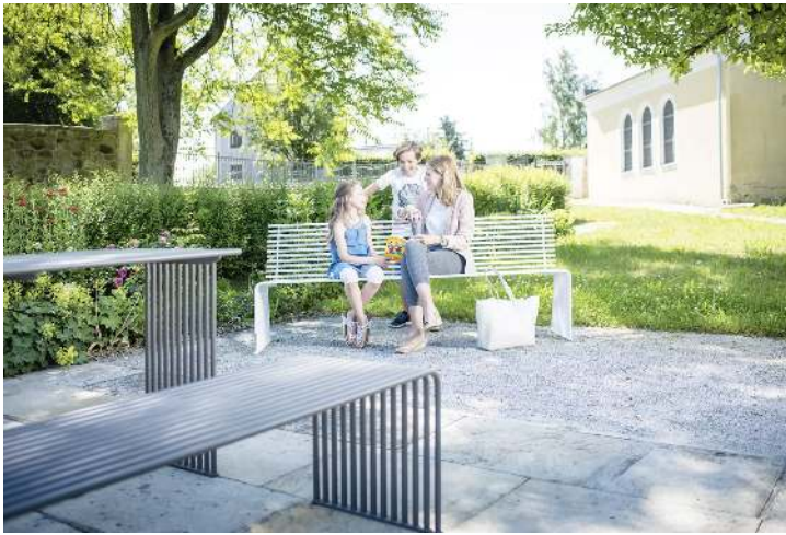
Sitzbank und Tisch ANZIO, in eisenglimmergrau bzw. in RAL 9003 signalweiß