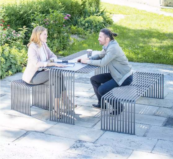
Kollektion ANZIO bestehend aus Sitzbank, Sitz, Tisch und Abfallbehälter, in eisenglimmergrau