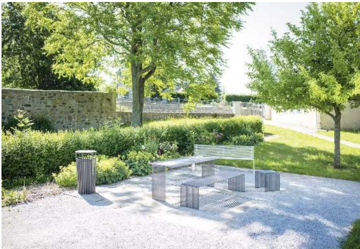
Kollektion ANZIO bestehend aus Sitzbank, Sitz, Tisch und Abfallbehälter, in eisenglimmergrau