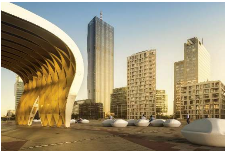
Sitzbank DNA aus Beton, in Granitoptik weiß