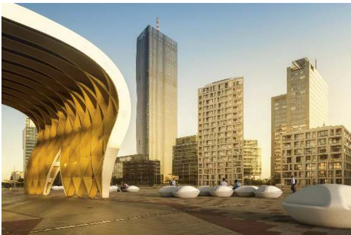
Sitzbank DNA aus Beton, in Granitoptik weiß