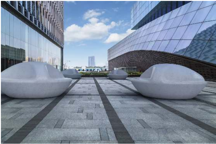
Sitzbank DNA aus Marmor, in weiß carrara