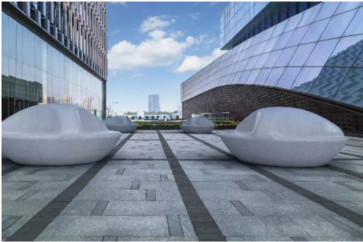
Sitzbank DNA aus Marmor, in weiß carrara