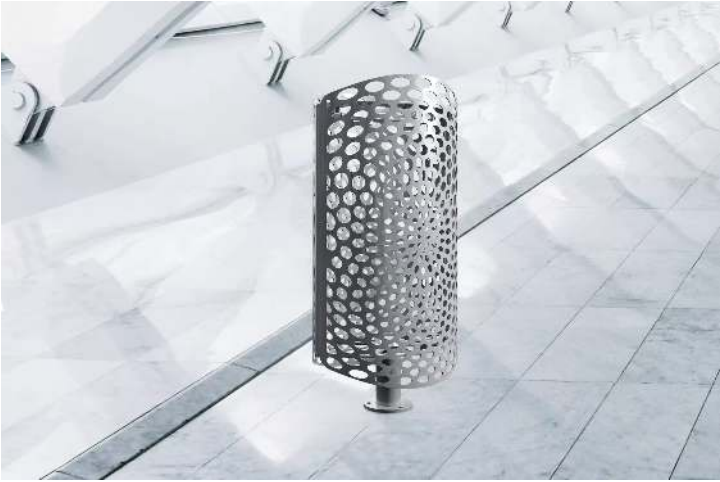
Abfallbehälter KEO in grau 2900 sable</div>