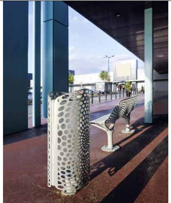
Abfallbehälter und Sitzbank KEO in grau 2900 sable</div>