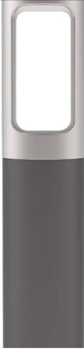
Poller KARL, Pollerkopf in RAL 9006 weißaluminium