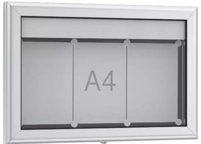
Schaukasten LUINO für 3 x DIN A4, Rückwand anthrazit