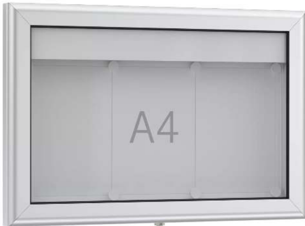
Schaukasten LUINO für 3 x DIN A4, Rückwand weiß