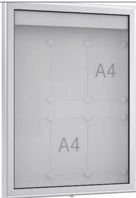
Schaukasten LUINO für 6 x DIN A4, Rückwand weiß