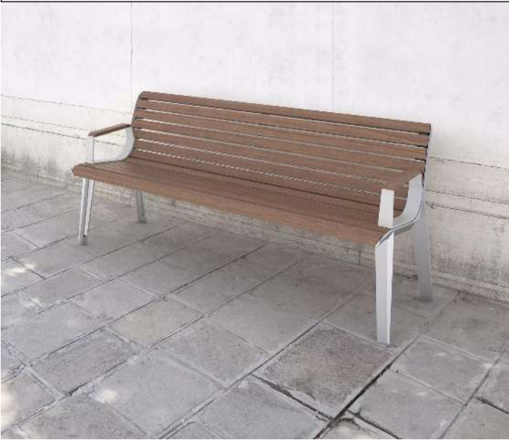
Sitzbank EMAU mit Rückenlehne und Armlehnen, mit Jatobaholzbelattung