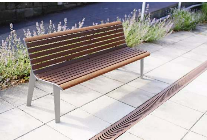
Sitzbank EMAU mit Rückenlehne, mit Jatobaholzbelattung