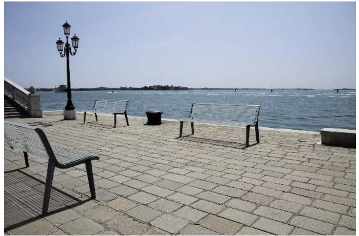
Sitzbank EMAU mit Rückenlehne, Auflage Edelstahl, Unterkonstruktion in RAL 7016 anthrazitgrau (auf Anfrage)