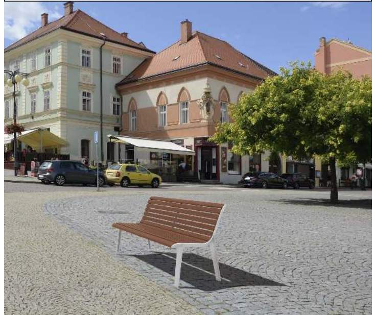
Sitzbank EMAU mit Rückenlehne, mit Jatobaholzbelattung