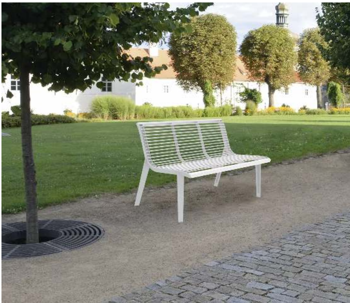
Sitzbank EMAU mit Rückenlehne, Edelstahl