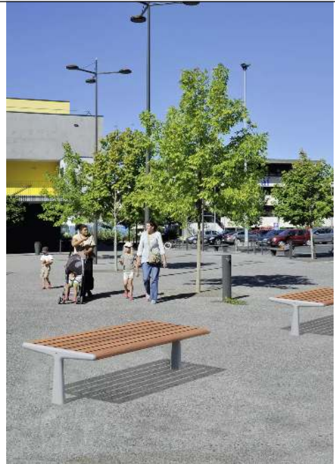
Sitzbank TEO ohne Rückenlehne, Gusseisenteile in RAL 7035 lichtgrau