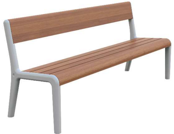
Sitzbank TEO mit Rückenlehne, Gusseisenteile in RAL 7035 lichtgrau