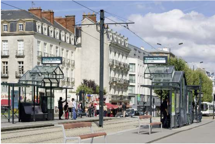
Sitzbank TEO mit verlängerter Rückenlehne, Gusseisenteile in RAL 7035 lichtgrau