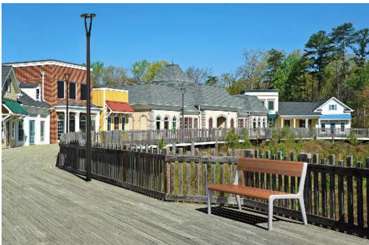
Sitzbank TEO mit Rückenlehne, Gusseisenteile in RAL 7035 lichtgrau