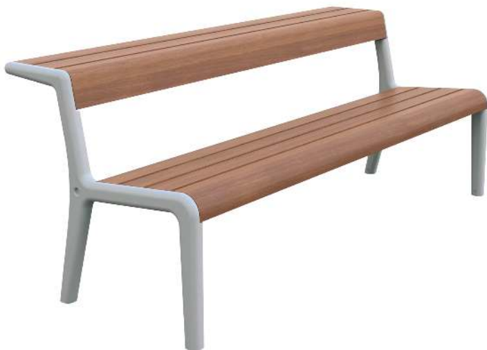
Sitzbank TEO mit verlängerter Rückenlehne, Gusseisenteile in RAL 7035 lichtgrau