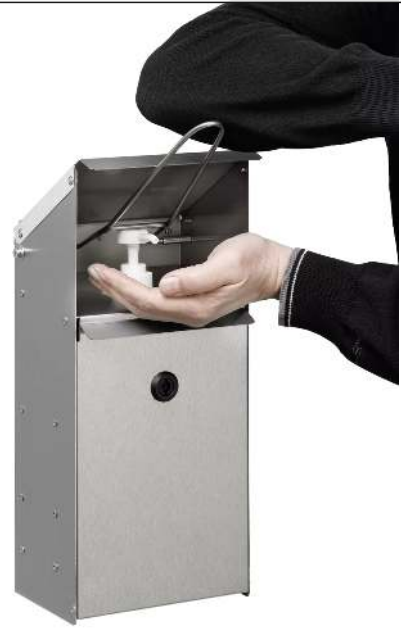
Handdesinfektionsspender NEATDES zur Wandbefestigung, aus Edelstahl