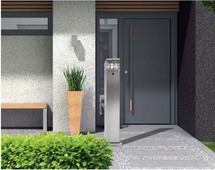
Handdesinfektionsspender NEATDES ohne Behälter, zum Aufdübeln, aus Edelstahl</div>