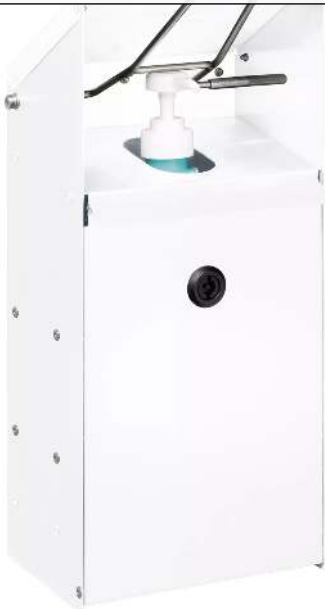
Handdesinfektionsspender NEATDES zur Wandbefestigung, in RAL 9016 verkehrsweiß