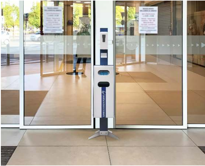
Desinfektionsstation SANIFICATION POINT BERING mit Dosierspender, in RAL 5010 enzianblau