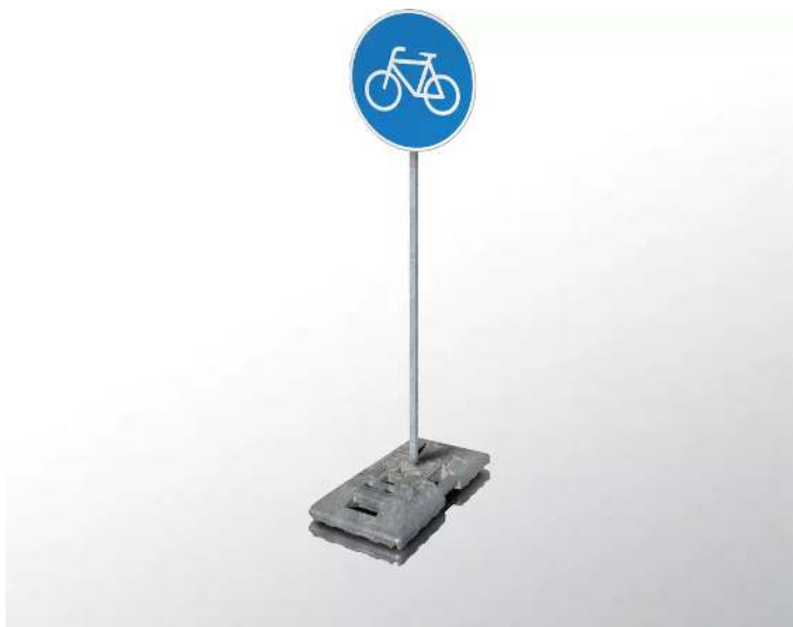
Verkehrszeichen-Set RADWEG, ø 420 mm