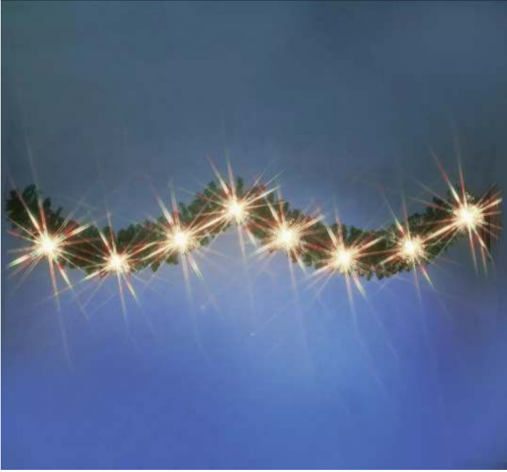
Zweiggirlande STARLIGHT, zur Straßenüberspannung