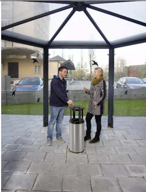
Abfallbehälter CALGARY mit Ascher, in silber ähnlich RAL 9006