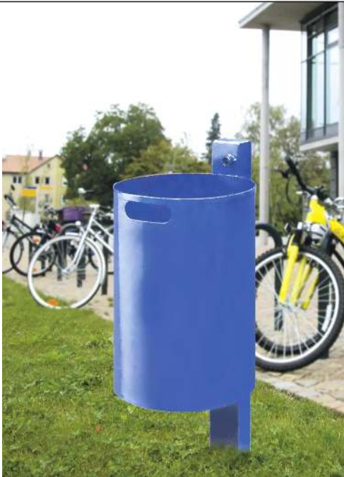
Abfallbehälter KINGSTON, Vollblech, ohne Schutzdach, in RAL 5017 verkehrsblau