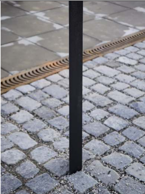
Poller LOT zum Aufdübeln bei -100 mm, in DB 703 eisenglimmer