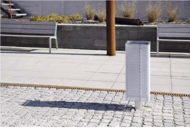
Abfallbehälter NANUK, quadratisch, Korpus: Streckmetall, in RAL 9006 weißaluminium