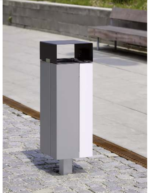
Abfallbehälter NANUK, mit Schutzdach, Korpus: Stahlblech, zweifarbig auf Anfrage