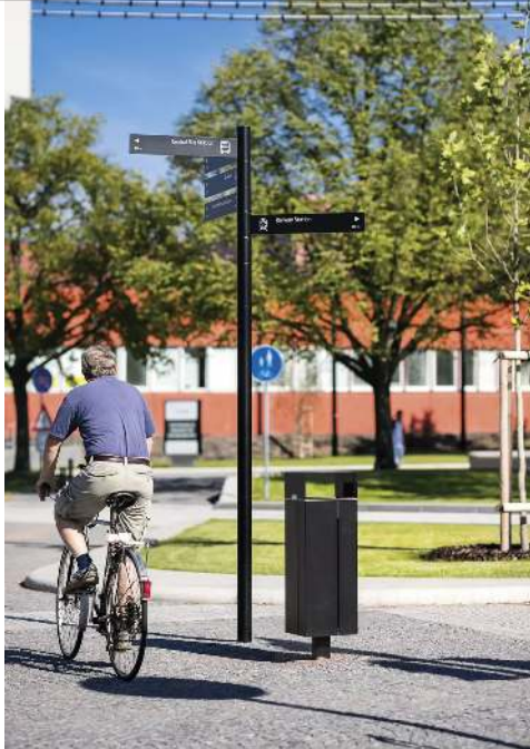
Abfallbehälter NANUK, quadratisch, mit Schutzdach, Korpus: Stahlblech, in RAL 7022 umbragrau