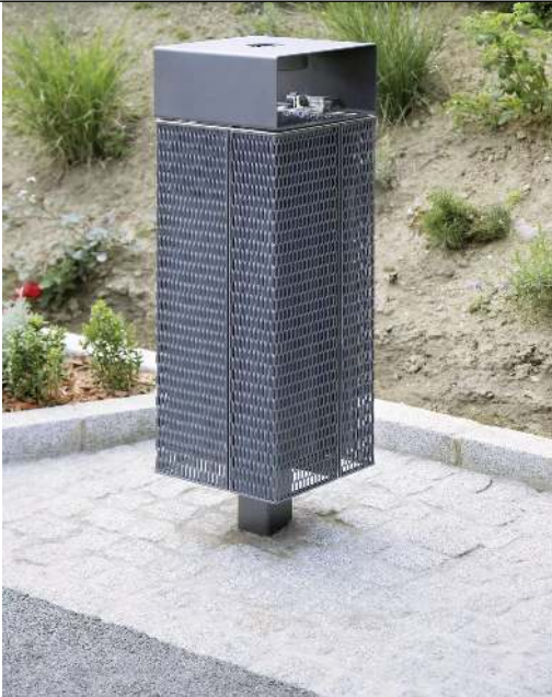
Abfallbehälter NANUK, quadratisch, mit Schutzdach und Ascher, Korpus: Streckmetall, in RAL 9007 graualuminium