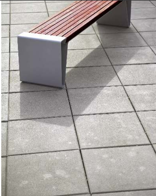
Sitzbank RADIUM ohne Rückenlehne, mit Jatobaholzbelattung, Stahlteile in RAL 9007 graualuminium