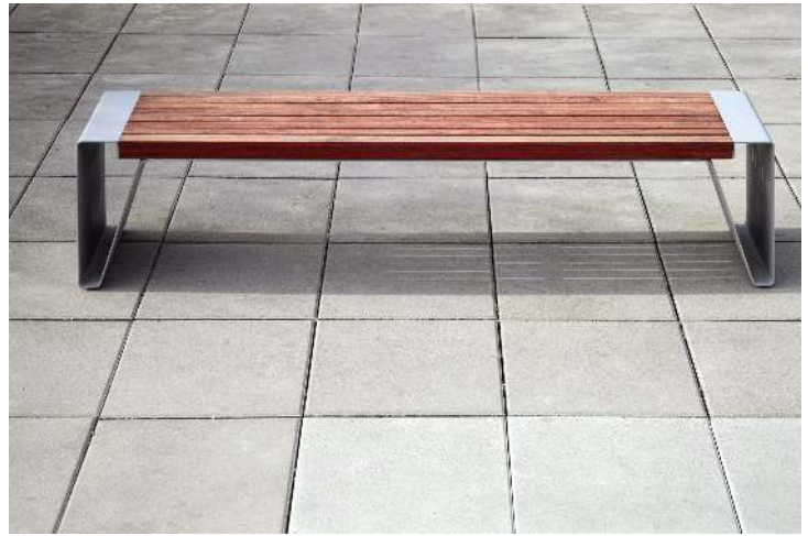
Sitzbank RADIUM ohne Rückenlehne, mit Jatobaholzbelattung, Stahlteile in RAL 9006 weißaluminium