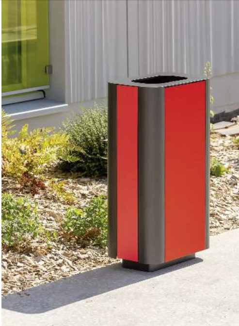
Abfallbehälter PAOSA, Stahlteile in DB 703 eisenglimmer, Korpus aus rotem Zedernholz