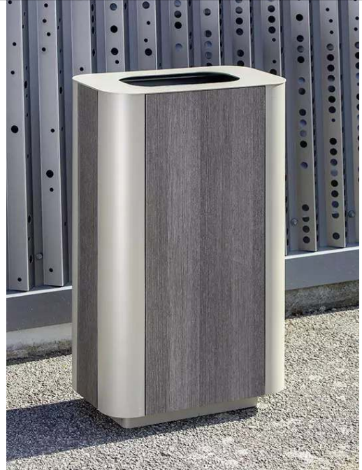
Abfallbehälter PAOSA, Stahlteile in DB 701 eisenglimmer, Korpus aus grauem Zedernholz