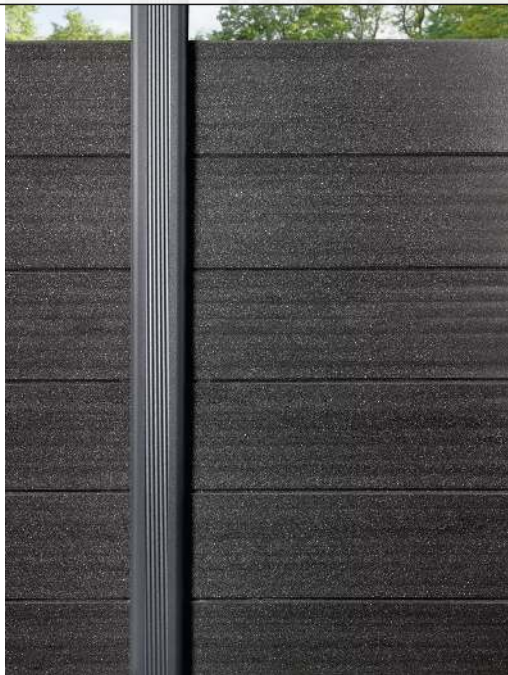
Detail: Grundstütze, Standardausführung für Sicht- und Schallschutzwand LYNWOOD in titangrau